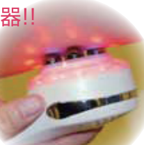
高性能マルチ4素子ヘッド

お問い合わせ(製造・発売元)株式会社ジェイ・ピー・マシナリー ☎0120-00-7980 http://www.jp-m.jp JBマシナリー 検索 ◀ サロンで培った施術ノウハウでサポート。