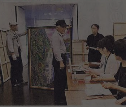
応募作品を会場に運び込む出品者たち＝県民会館

13日に開幕する「第70回県展」の応募受け付けが8日、会場の県民会館で始まり、創作に情熱を傾ける県民らが各部門に意欲作を寄せた。9日午前10時から午後6時まで出品に対応する。 県展は日本画、洋画、彫刻、工芸、書、写真の6部門からなる県的美術公募展。この日